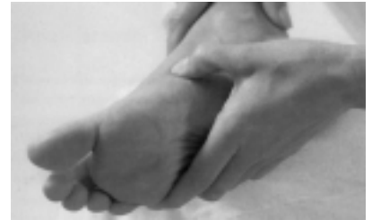
Die richtigen Handgriffe für eine Massage sind leicht zu lernen.

Mit der Fußreflexzonenmassage können eine ganze Reihe von Erkrankungen behandelt werden. In