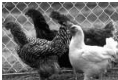
Eier aus konventioneller Haltung haben in Versuchen deutlich weniger Licht gespeichert als solche aus Bio-Haltung.