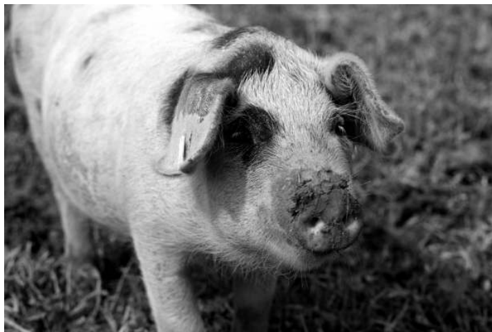
BLE, T. Stephan

Fleisch wird aufgrund seines Fett- und Cholesterinanteils als eher negativ für die Gesundheit bewertet. Allerdings ist Fleisch in den letzten 20 Jahren immer fettärmer geworden. Verantwortlich für den Rückgang sind vor allem die gegenüber früher wesentlich magereren Zuschnitte, das heißt, es wird von vornherein mehr Fett weggeschnitten. Zudem werden tendenziell immer jüngere Tiere geschlachtet, auch neue Zuchtstrassen und anders zusammengesetzte Futtermittel spielen eine Rolle. Mageres Fleisch, bei dem man kein Fett sehen kann – egal ob Schwein, Rind, Pute oder Huhn – enthält heute nur noch zwischen 1 und 4 Gramm Fett pro 100 Gramm. Am deutlichsten ist der Rückgang des Fettgehaltes bei Schweinefleisch. Enthielten 100 Gramm Schweinefilet 1991 noch knapp 9 Gramm Fett, sind es heute gerade noch 2 Gramm. Auch bei sehr fetten Fleischteilen wie beispielsweise Schweinebauch ist der Fettgehalt im selben Zeitraum von knapp 33 auf rund 21 Gramm pro 100 Gramm gesunken. Beim Rindfleisch konnten die Fettgehalte im Laufe der letzten Jahrzehnte