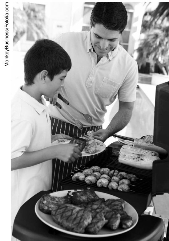
Männer essen deutlich mehr Fleisch. Dadurch steigt ihr Krebsrisiko. Gegrilltes kann zudem kanzerogene Stoffe enthalten.

Auch das Magenkrebsrisiko (ausgenommen Krebs am Magen- Eingang) steht laut der EPIC-Studie mit der Aufnahme von rotem Fleisch in Verbindung. Für Personen, die mit dem Magenbakterium Helicobacter pylori infiziert sind, ist das Risiko bei 100 Gramm verzehrtem Fleisch oder Fleischprodukt täglich sogar um das Fünffache erhöht. Des Weiteren zeigen Studien einen Zusammenhang zwischen dem Konsum von rotem Fleisch und einem höheren Risiko für Bauchspeicheldrüsenkrebs sowie hormonabhängigen Brustkrebs.